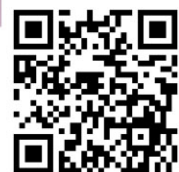
復活節尋彩蛋大作戰作品欣賞

因應疫情停課期間，除了透過自學網站自學材料，老師講解的教學影片及網上實時課堂外，學校亦於復活節假期推出「復活節尋彩蛋大作戰」，透過多元化的學習任務，讓學生發揮創意，並透過當中的閱讀與環保元素響應世界地球日和世界閱讀日。大家可透過QR code到訪網站，重溫任務及欣賞同學作品。