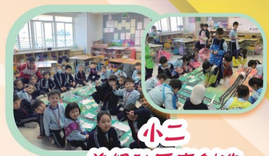
小二 美好社區齊創造