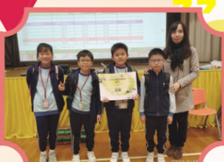
「Race to the line micro: bit英國模型火箭車同樂日」