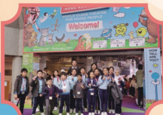
Kids Fest 2020