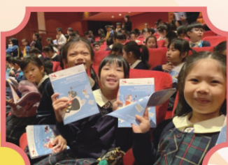
賽馬會音樂密碼教育計劃