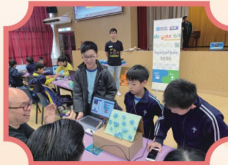
do your: bit hackathon 2020