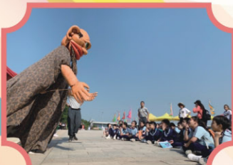
誇啦啦「浮游之樂」藝動沙螺灣