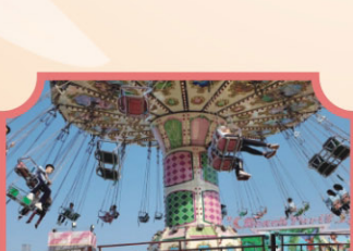
友邦嘉年華stem導賞團