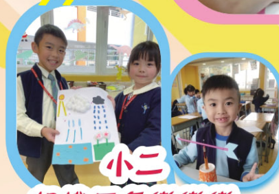
小二 認識天氣變變變