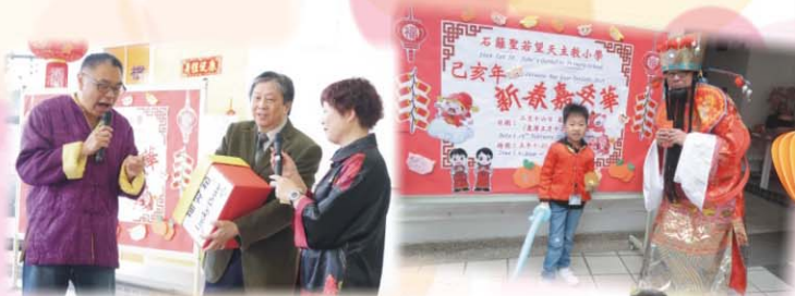
新春嘉年華及文化日當天的活動花絮