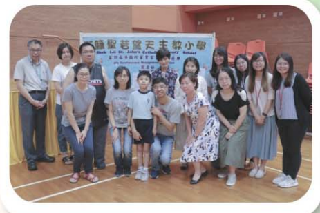
「第四屆法團校董會家長校董選舉」當天情況